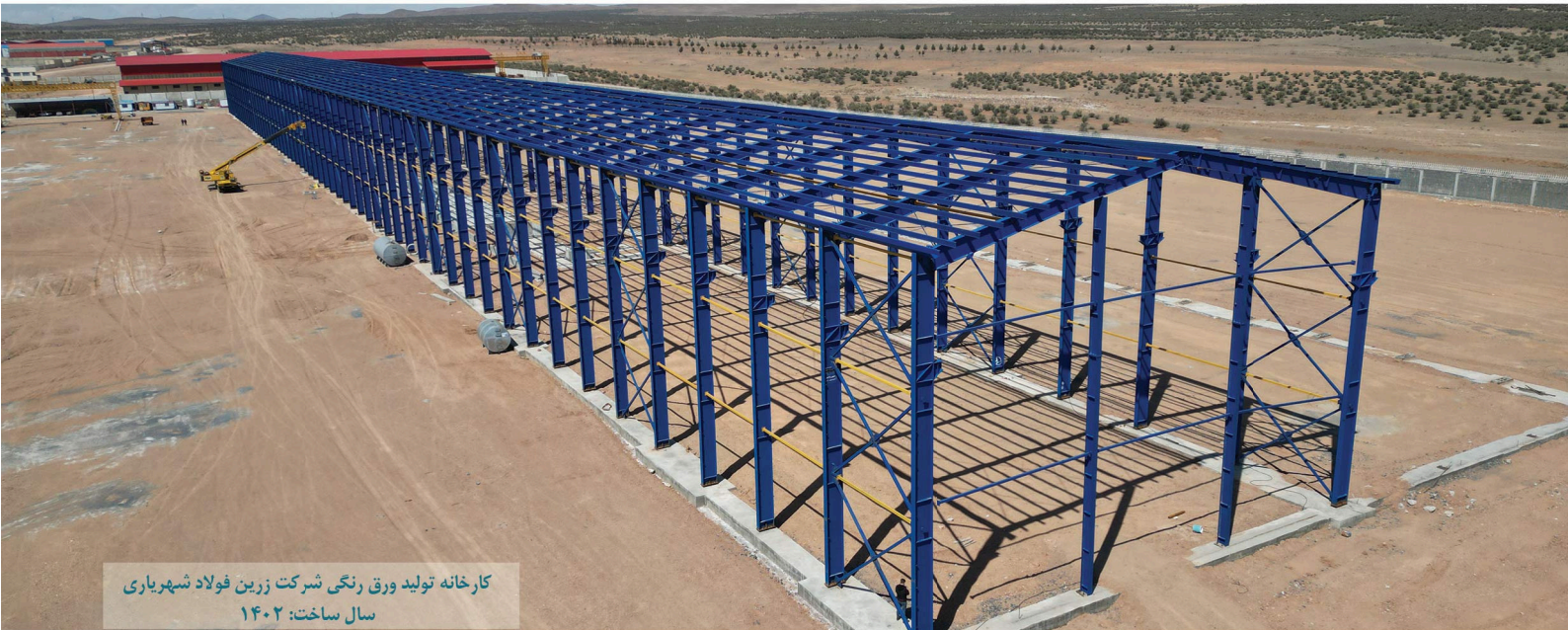
کارخانه تولید ورق رنگی شرکت زرین فولاد شهرداری سال ساخت: ۱۴۰۲